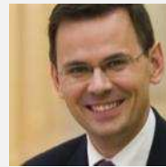
Jeugd en Gezin